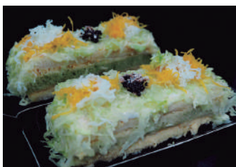
· Tonyina 5,40 €