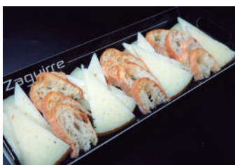
· Formatge sec 14,00 €