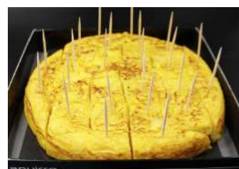
· Trita de patates 14,00 €