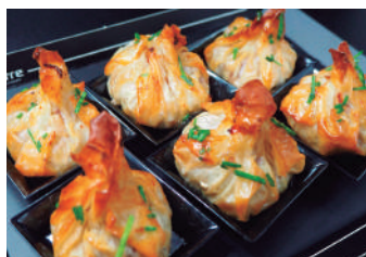
· Farcellet de pollastre i crema de formatge 2,90 €