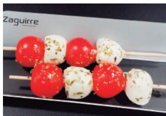
· Broxeta Caprese 2,65 €