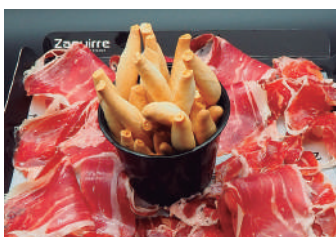
· Pernil ibèric 18,00 €