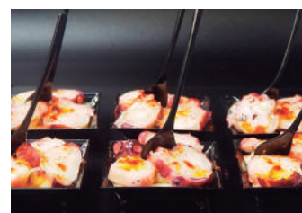
· Pop a la gallega 3,40 €