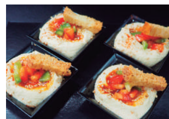
· Hummus 2,60 €