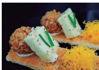
· Bombó de formatge de cabra i brie 2,50 €