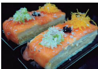
· Salmó 5,80 €