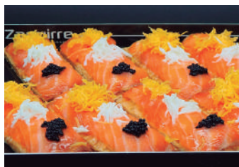
· Mil fulls de salmó 2,50 €