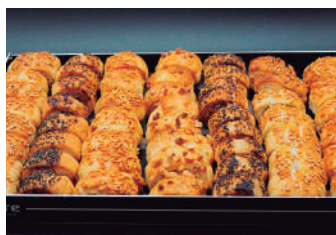
· Pasta salada (50 u) 32,00 €