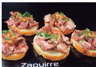
· Rosbif amb mostassa de Dijon 2,50 €