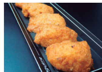
· Bunyols de bacallà 1,80 €