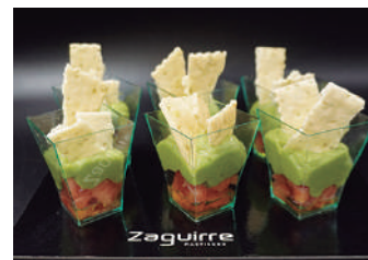
· Guacamole amb tomàquet 3,20 €