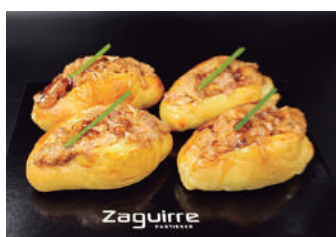
· Polled pork 2,90 €