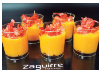
· Crema de carbassó amb pernil 2,90 €