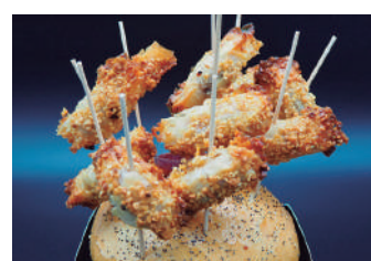
· Pics cruixents de botifarra 2,30 €