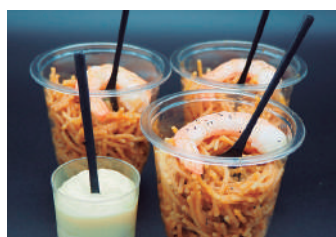
· Fideuà 3,95 €