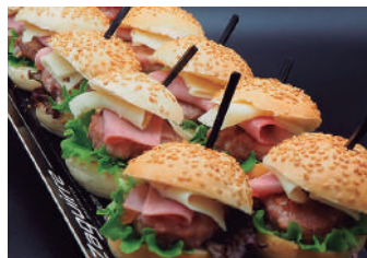
· Mini burger 2,60 €