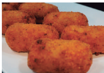
· Croquetes de pernil ibèric/pollastre/ceps 1,80 €